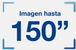
Imagen de hasta 150" en Full HD, con colores vibrantes incluso con luz ambiente.